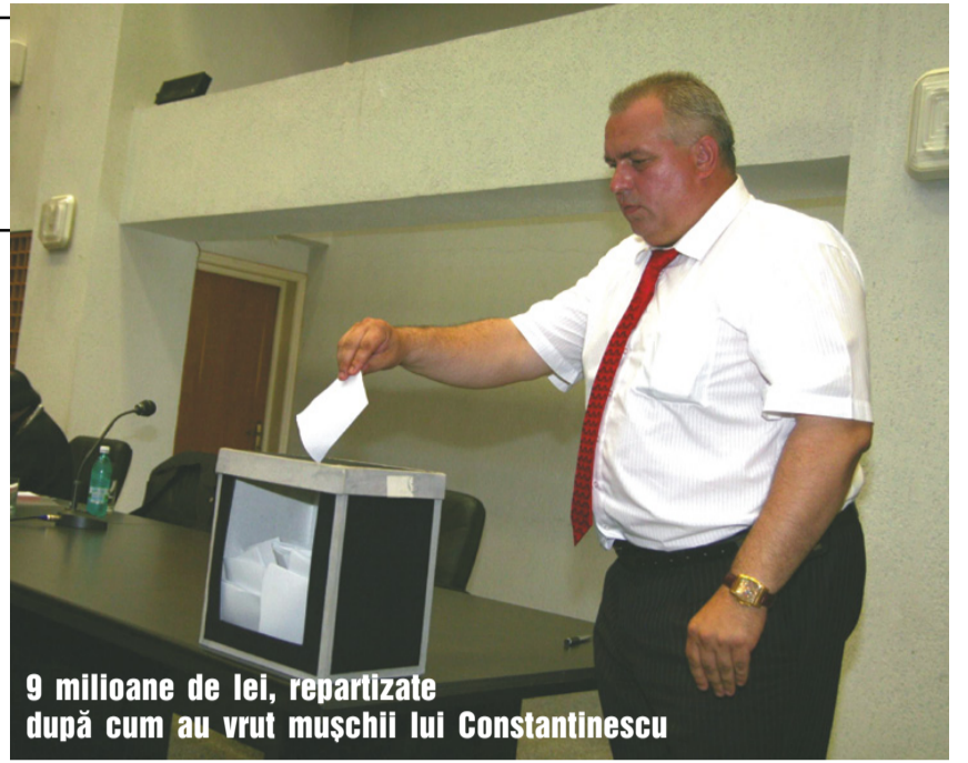
9 milioane de lei, repartizate după cum au vrut mușchii lui Constantinescu

Cotidian de opinie și informație Cuget Liber Fondat în 1944 www.cugetliber.ro Anul XVIII, nr. 5517 48 pagini, 70 bani Miercuri, 13 august 2008